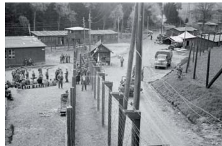
Une partie de l'enceinte barbelée du camp de Vaihingen

Mainau, sur le lac de Constance, où ils seront rejoints par ceux de Dachau, libérés par les Américains. Ils rentrent ensuite en France.