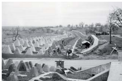
Dents de dragons de la ligne Siegfried. Un passage a été ouvert par les troupes françaises.

L'armée Patton ayant roqué* vers le nord en direction de Francfort, la 7 ème Armée du général Patch doit suivre le mouvement. La 1 ère Armée du général de Lattre doit s'aligner sur ce mouvement. Elle pénètre en Allemagne en forçant la ligne Siegfried puis arrive au Rhin.