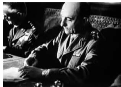
Signature par le général de Lattre de l'acte de capitulation

de dire : « Ah ! il y a même les Français, il ne manquait plus que cela. »