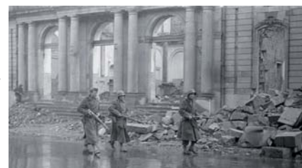
Patrouille dans les ruines de Stuttgart

La 2 ème DIM et la 5 ème DB vont ensuite se diriger vers Stuttgart, coordonner leur attaque avec la 3 ème DIA et anéantir le 64 ème corps d'armée allemand. Stuttgart tombe le 20 avril, 28 000 Allemands sont prisonniers pour 175 tués et 510 blessés français.