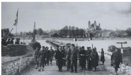
Traversée du pont construit par le Génie français, à Spire, sur le Rhin.

Le général de Gaulle vient rendre visite à la 1 ère Armée. Le 6 avril, il franchit le Rhin à Spire et il est, le 7 avril, à Karlsruhe.