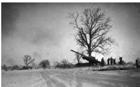
Batterie de canons américains

Les Américains, qui ont réussi à stopper les Allemands dans les Ardennes, apportent une aide massive à la Première Armée. Le général de Lattre bénéficie du renfort des 3 ème et 28 ème Divisions d'Infanterie américaines mais aussi de la 2 ème DB qui dépendait de la VII ème Armée américaine.