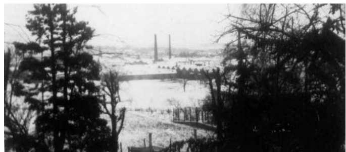
La teinturerie de Pfastatt, sous la neige, avant les combats.

Le déclenchement des opérations, par le sud, est fixé au 20 janvier 1945. Par - 20° et une tempête de neige, c'est le II/23 ème Régiment d'Infanterie Coloniale, du commandant de Loisy, qui déclenche, à 7 heures, l'offensive en s'emparant de la teinturerie de Pfastatt.