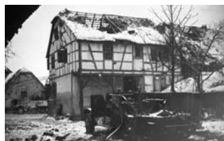
Maisons bombardées dans le secteur d'Ostheim, au nord de Colmar. Au premier plan on distingue un half-track détruit.

Il fait 51 prisonniers en une demi-heure. C'est ensuite la libération des villages et des cités des mines de potasse au nord de Mulhouse. Le 22, le 2 ème corps d'armée attaque au nord. Du 26 au 29, ce sont les violents combats de Jepsheim et Grussenheim pour le 1 er Régiment de Chasseurs Parachutistes, le groupement de choc et la 2 ème DB.