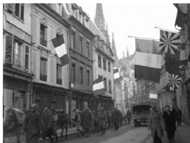
Fantassins du 6 ème RTM dans une rue de Mulhouse pavoisée au lendemain de sa libération.

Malgré l'ardeur des troupes françaises qui ont permis en quelques jours d'arriver au Rhin le 19 novembre 1944, de libérer Belfort et Mulhouse, le 21, et de faire 17 000 prisonniers, les Allemands résistent dans une zone de 60 km sur 50 autour de Colmar.