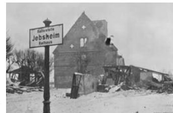
Place de la Mairie de Jepsheim, au nord de Colmar. Il ne reste que l'arrêt de bus. Les combats dans le village ont été particulièrement violents.