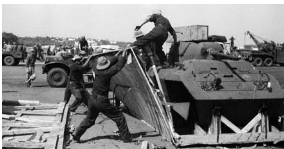
Livraison de matériel américain à Casablanca. Ici une automitrailleuse M 8

Janvier 1944 voit la fixation définitive des troupes françaises de la Troop list , c'est-à-dire les troupes agréées et soutenues par les Américains. Disparaissent alors la 10 ème DIC, la 8 ème DIA, puis la 7 ème DIA dont l'équipement est transféré à la DFL qui disposait d'armement anglais. Leurs effectifs serviront à renforcer les divisions d'Italie, durement affectées par les combats et à créer la base 901 destinée au soutien des troupes en France. Quant à la 3 ème DB, elle servira de renfort, avant sa dissolution en août 1944. A cette date les livraisons américaines représentent 1.050.000 tonnes. Le montant global de l'aide est de 2.250 millions de dollars. La France compense par 850 millions de dollars provenant de la location des installations alliées d'Afrique du Nord.