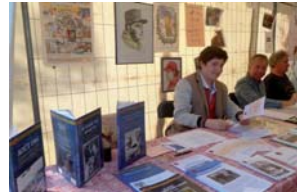
Le stand du Comité départemental a attiré un nombreux public : une occasion de rencontres et d'échange.