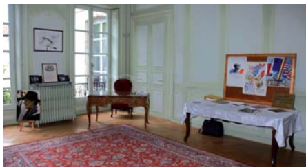
Bureau occupé par le général de Lattre du 19 septembre au 14 novembre 1944. C'est en ces lieux que l'Armée B est devenue la Première Armée Française

A l'occasion des Journées du Patrimoine , le 15 septembre, des documents et des photos du Maréchal de Lattre ont été prêtés par le Comité de Côte d'Or pour être exposés dans le bureau que le général de Lattre a occupé à l'Hôtel Clévans de Besançon, aujourd'hui résidence du gouverneur militaire.