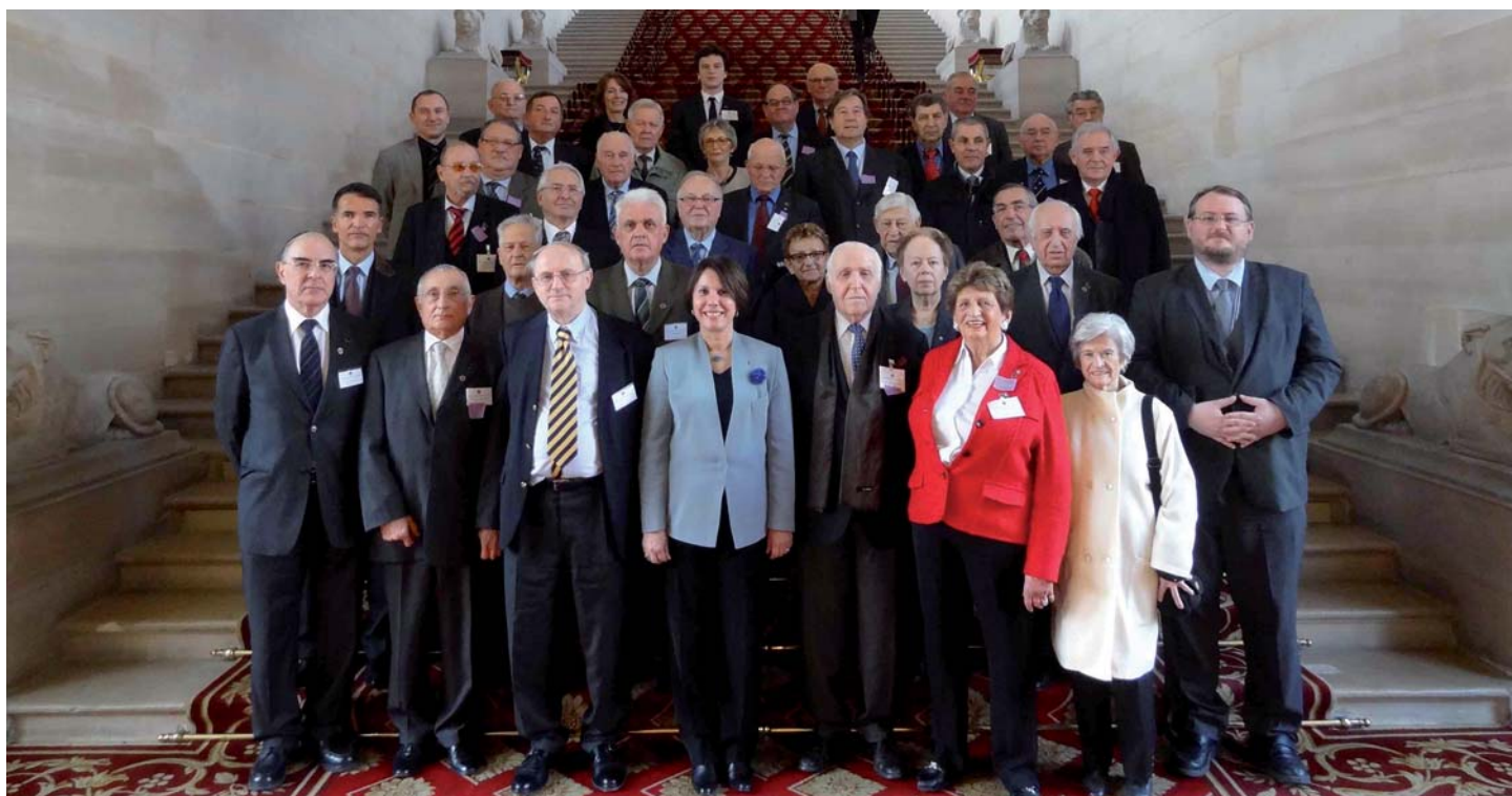
Traditionnelle photo-souvenir au pied de l'escalier d'honneur du palais du Luxembourg

Palais du Luxembourg, jeudi 14 novembre 2013