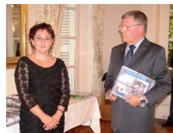
Remise du prix par le président Fontaine au collège Saint-Exupéry.

Quatre collèges du département, particulièrement investis dans des actions de mémoire (participation aux cérémonies patriotiques,