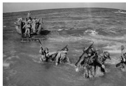
Exercice de débarquement.

L'armée B prend place dans le dispositif Anvil. Le débarquement aura lieu à l'Est de Toulon. Les troupes françaises ont mission de conquérir Toulon et Marseille indispensables à l'approvisionnement des troupes alliées, pendant que les troupes américaines couperont la route aux Allemands en retraite. Le général de Lattre obtient que la 9 ème DIC, le bataillon de choc et les commandos d'Afrique suivent une formation de troupes de débarquement, type « Marines ».