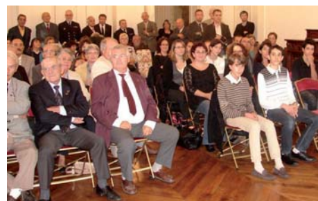
Une partie de l'assistance dans les salons de la préfecture.

Le jeudi 17 octobre, en partenariat avec l'Union départementale des Anciens Combattants et l'Amicale des Portedrapeaux des Deux-Sèvres, le Comité départemental a procédé à la remise Prix d'histoire 2013.