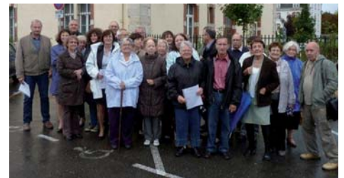
Les participants devant le siège de l'ONACVG de Dijon au moment du départ.